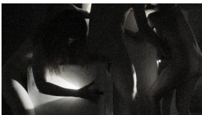
"Involved" (2017) af Katja Bjørn på Horsens Kunstmuseum

På Horsens Kunstmuseum kan man frem til den 19. maj 2019 opleve Katja Bjørns videoinstallation "Involved". Værket består af seks høje, skrånede planker, hvorpå en sort-hvid video viser en gruppe nøgne mennesker i alderen 24-75 år, der flytter rundt på nogle tunge blokke. Deres asen og masen oplyses glimtvis af lommelygter.