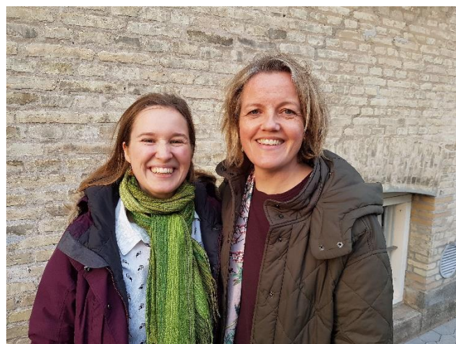
"Vi ser frem til vores samarbejde!"

... det er min drivkraft at være præst for mennesker i livets store overgange og midt i hverdagen, samt at formidle kristendom på en nutidig, kreativ og let forståelig måde. Jeg ser frem til både konfirmand- og minikonfirmandundervisning, samtaler, gudstjenester, sang og samvær med jer alle i mangfoldige sammenhænge.