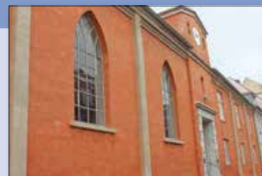
Hospitalskirken i Hospitalsgade