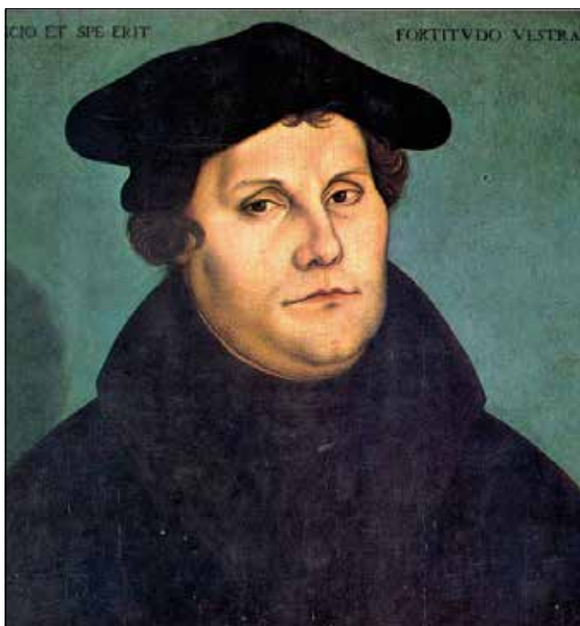
Martin Luther, 1529, maleri.

I 1529 skrev Martin Luther sit Skrift mod Tyrken . I skriftet skelner Luther mellem den kristnes pligt som kristen og den kristnes pligt som borger . Han gør op med pavestolens opfor-