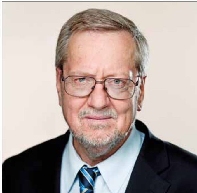
Per Stig Møller

Torsdag den 24. april kl. 19.30 i Klostergården fortæller forhenværende minister, nu MF for de Konservative, Per Stig Møller, om digterpræstens liv, værker og indsats under besættelsen.