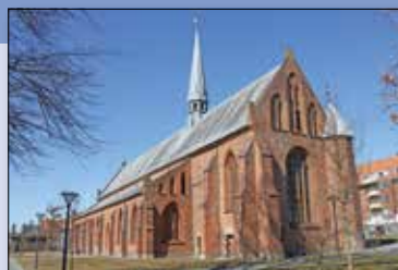
Klosterkirken i Borgergade

tlf. 24 61 09 79 e-mail: rwh@km.dk, Havneallé 12 A, 8700 Horsens. Træffes efter aftale, mandag er fridag.